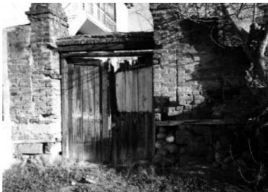
Εικ. 1. Αραμπατζή μαχαλάς.