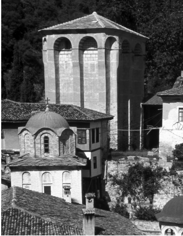
Εικ. 7 (αριστερά). Ο πύργος και το παρεκκλήσι του Ευαγγελισμού με το κτίριο του Συνοδικού, Μονή Τιμίου Προδρόμου Σερρών.