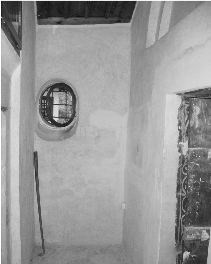
Εικ. 4. Καθολικό, παρεκκλήσι Αγίου Νικολάου, εσωτερική άποψη του νοτίου προσκτίματος, Μονή Τιμίου Προδρόμου Σερρών.