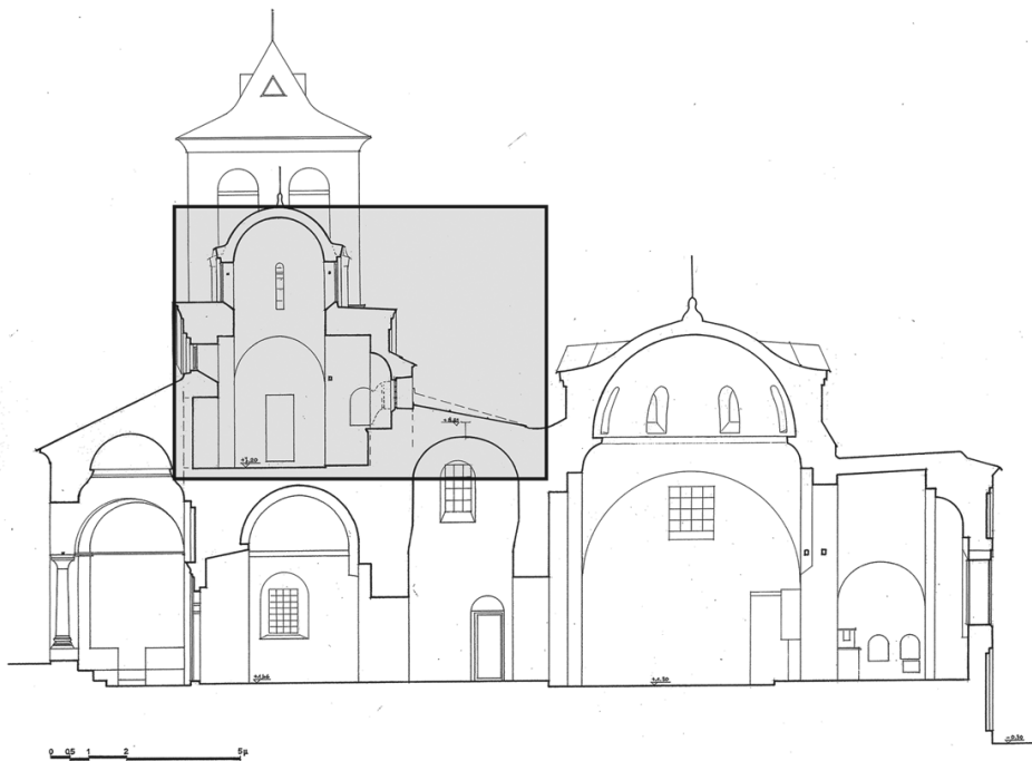
Εικ. 2. Καθολικό, τομή κατά μήκος, Μονή Τιμίου Προδρόμου Σερρών (αποτύπωση-σχέδιο Παντελή Ξύδα).