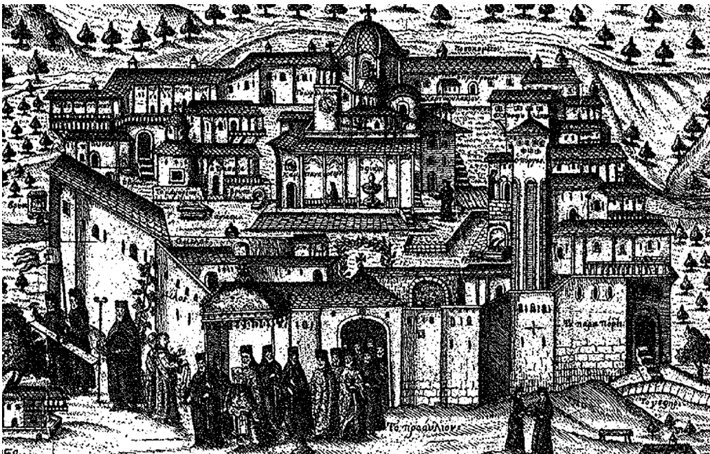
Εικ. 6. Λεπτομέρεια χαλκογραφίας της Μονής Προδρόμου, Βιέννη 1761.