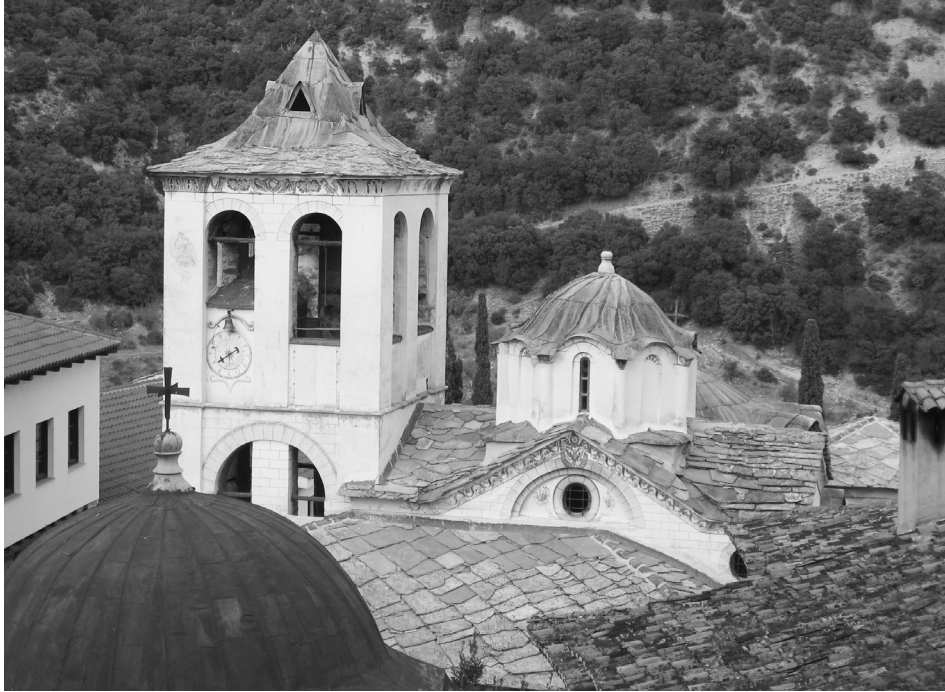
Εικ. 1. Καθολικό, παρεκκλήσι Αγίου Νικολάου, δυτική όψη, Μονή Τιμίου Προδρόμου Σερρών.