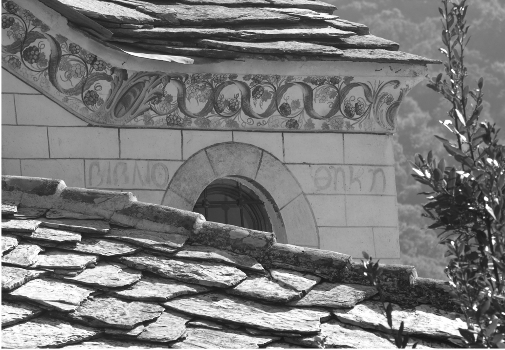
Εικ. 5. Καθολικό, παρεκκλήσι Αγίου Νικολάου, λεπτομέρεια δυτική όψης όπου διακρίνεται η γραπτή επιγραφή «βιβλιο...θήκη», Μονή Τιμίου Προδρόμου Σερρών.