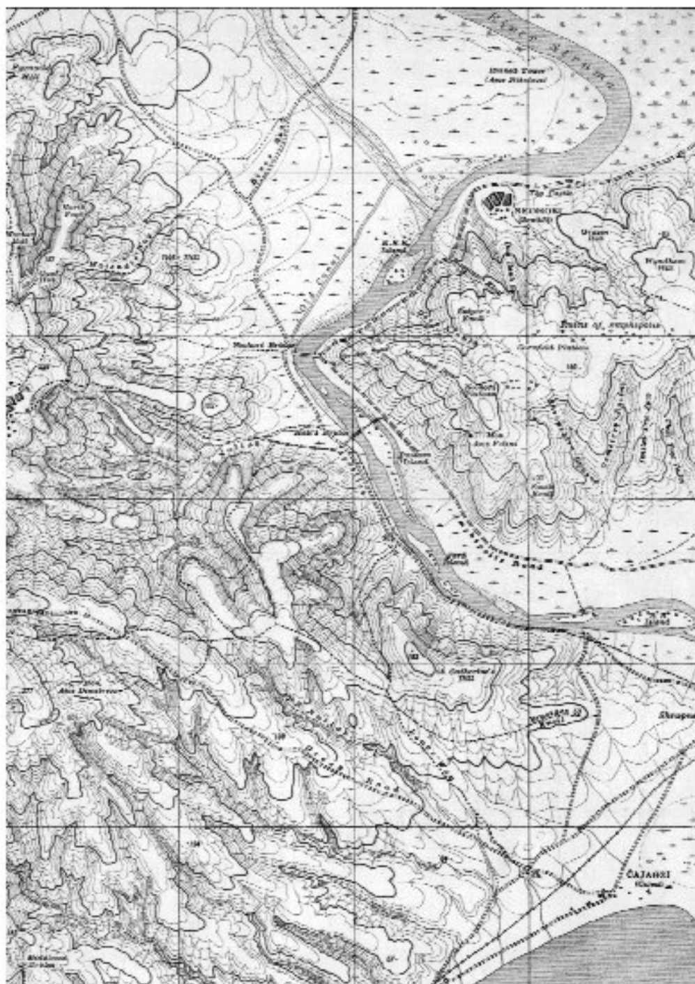
Εικ. 2. Η περιοχή του Γενίτσιοι με το Νησίον του Ζαστρίου (Pontoon Island), όπου απολήγει η σιδηροδρομική γραμμή (Λεπτομέρεια χάρτη της Στρατιάς της Ανατολής, No 419, Neohori, 24-3-18, κλίμ. 1: 20.000).