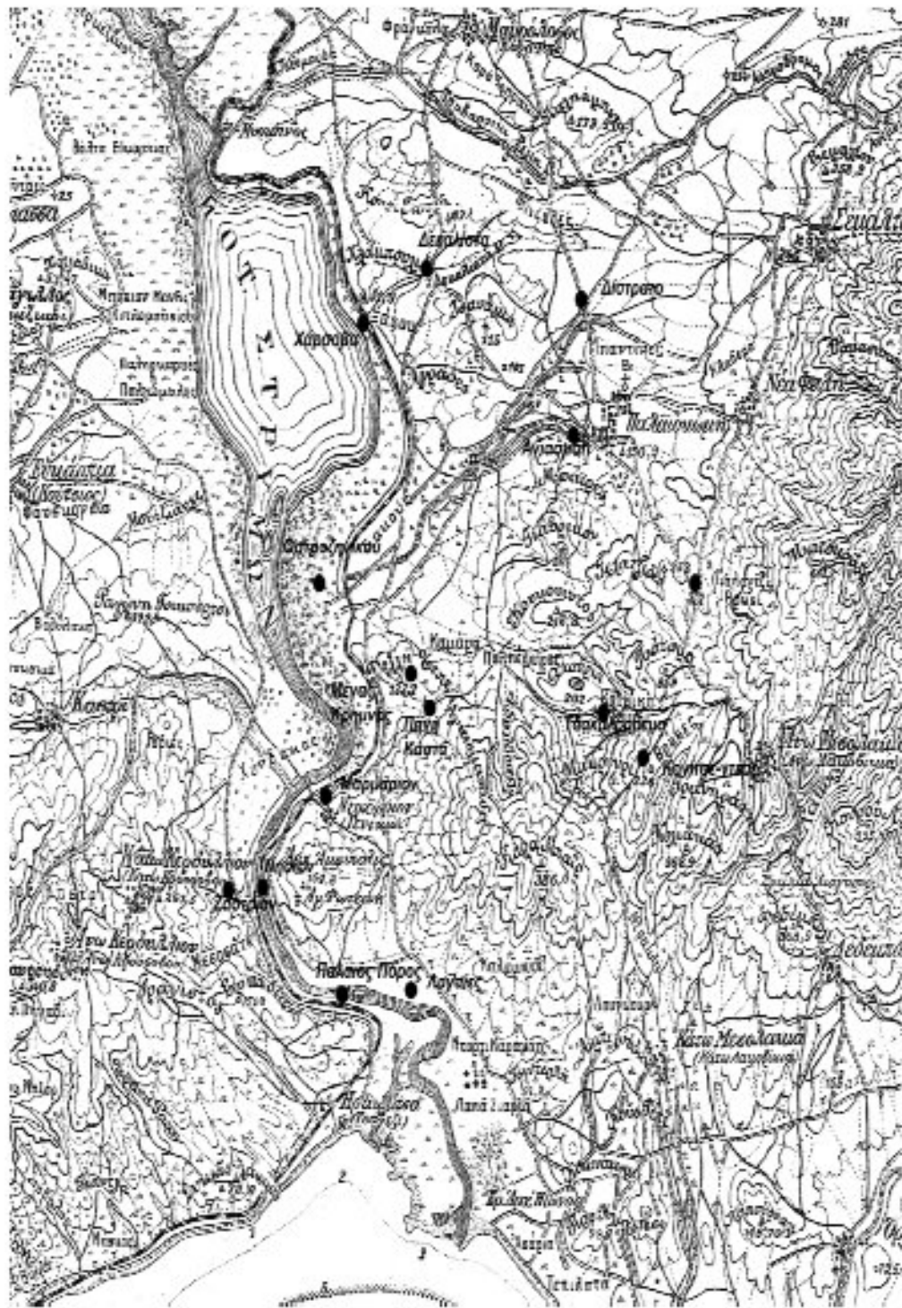
Εικ. 3. Οροθέσια του παντοκρατορικού μετοχίου σε υπόστρωμα χάρτη της ΓΥΣ (1928, φύλλο Ροδόλφος, κλίμ. 1: 100.000).