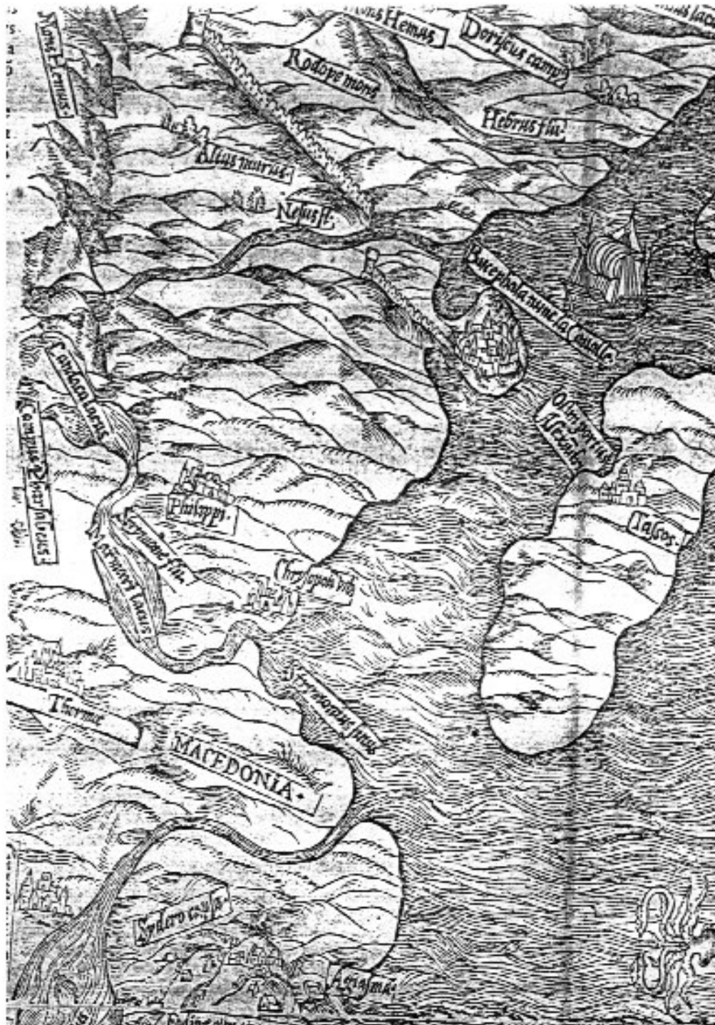
Εικ. 1. Οι λίμνες Χάνδακα και Μαρμαρίου Λεπτομέρεια χάρτη του Pierre Belon (1554).