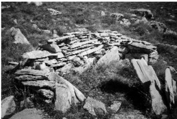
Εικ. 21. Ουτζιγκίκι στο Μενοίκιο.