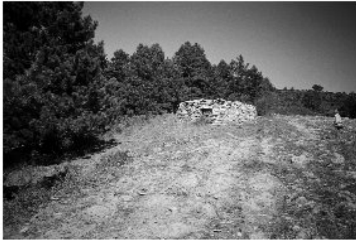
Εικ. 8. Η ερειπωμένη καλύβα στο Κούτελι. Γενική άποψη από τα νότια.