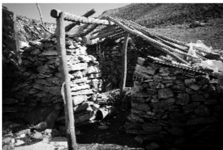
Εικ. 12. Η είσοδος της «Γκρέκο Καλίβα».