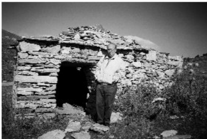
Εικ. 5. Η καλύβα στη Δέλβιστα Ορεινής. Ο συγγραφέας μπροστά στην είσοδο για να υπολογισθούν οπτικά οι διαστάσεις.