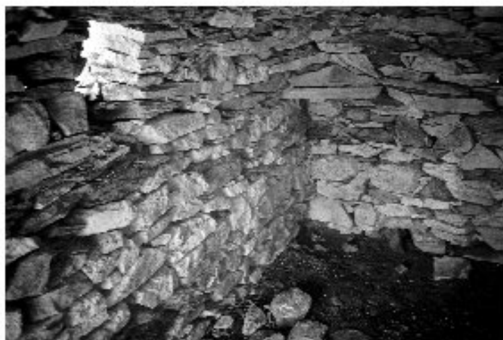
Εικ. 7. Η καλύβα στη Δέλβιστα. Μια από τις τριγωνες πλάκες όπου στηρίζεται ο θόλος.