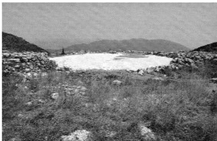
Εικ. 25. Ερειπωμένοι βόλτοι με αλάφι στη Λευκάδα.