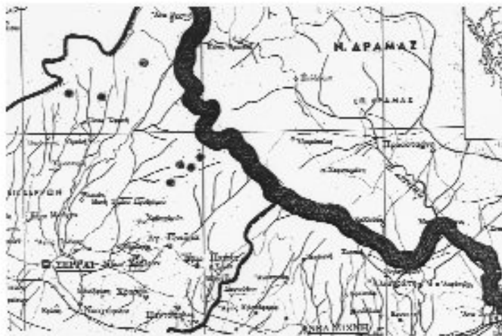
Χάρτης της περιοχής Σερρών με τα σημεία των περιγραφόμενων καλιβών.