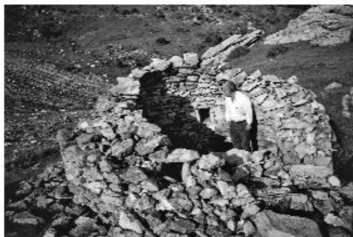
Εικ. 2 Η καλιβία στο Κουρί Ο Γιώργος Θεοχάρης μέσα για να υπολο- γισθούν οπτικά οι διαστάσεις.