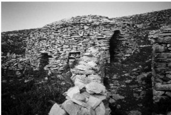
Εικ. 15. Η καλύβα στη θέση Καραμάνδρα. Η είσοδος.