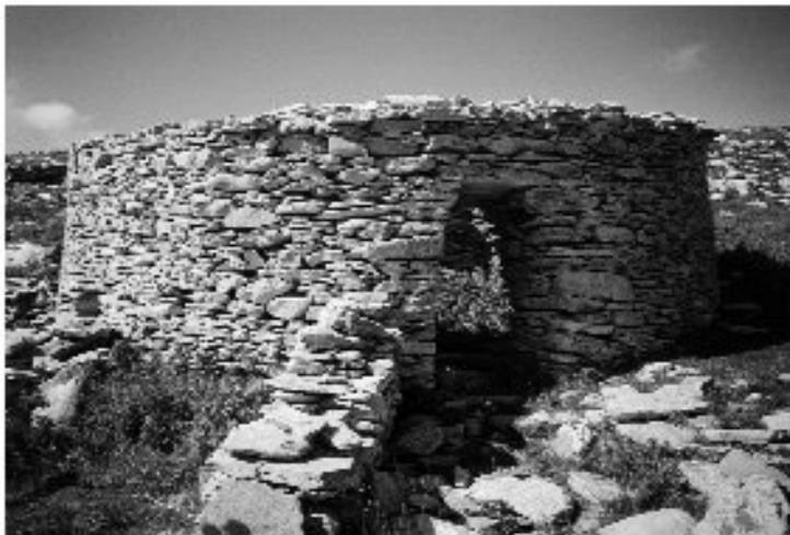
Εικ. 18. Η είσοδος της καλύβας στη θέση Ρουστάκα.