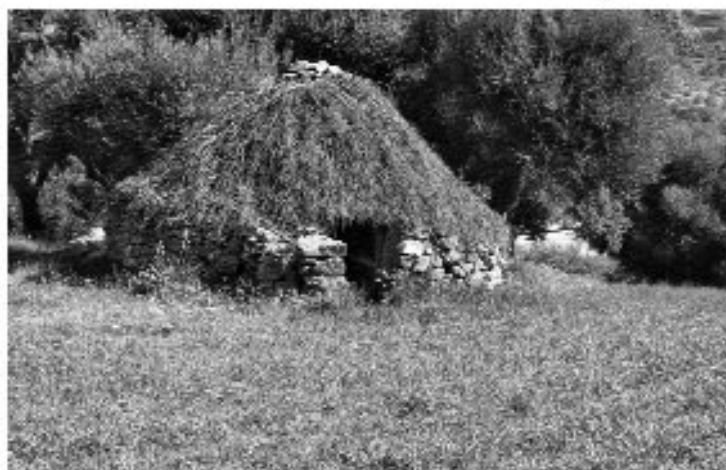
Εικ. 30. Πέτρινη στρογγυλή καλίφτα rihnettu με στέγη από χόρτα στη Σαρδηνία.