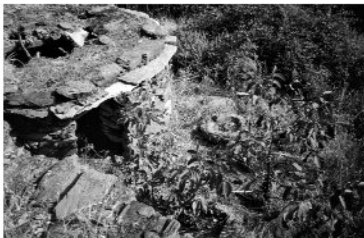
Εικ. 27. Κοιμάτσι για το χοί- ρο στο Καβοντάρο της Εύβοιας.