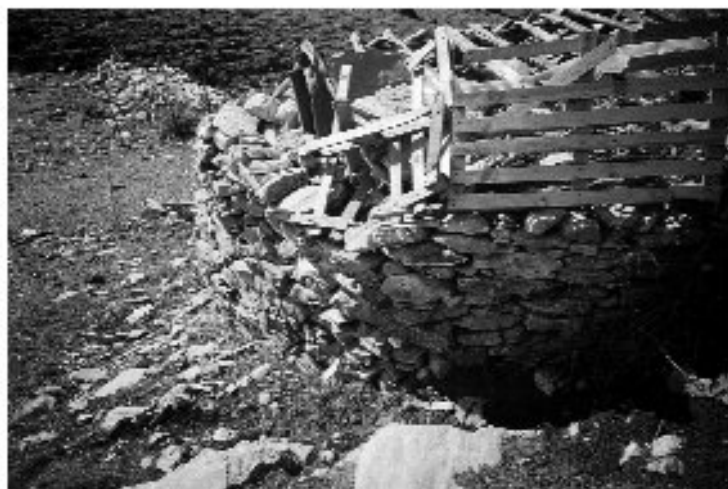
Εικ. 11. Η «Γκρέκο Καλίβα» στο Μενούκια.