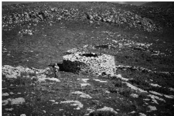
Εικ. 19. Η καλύβα στη θέση Ρουστάκα από τα δυτικά.