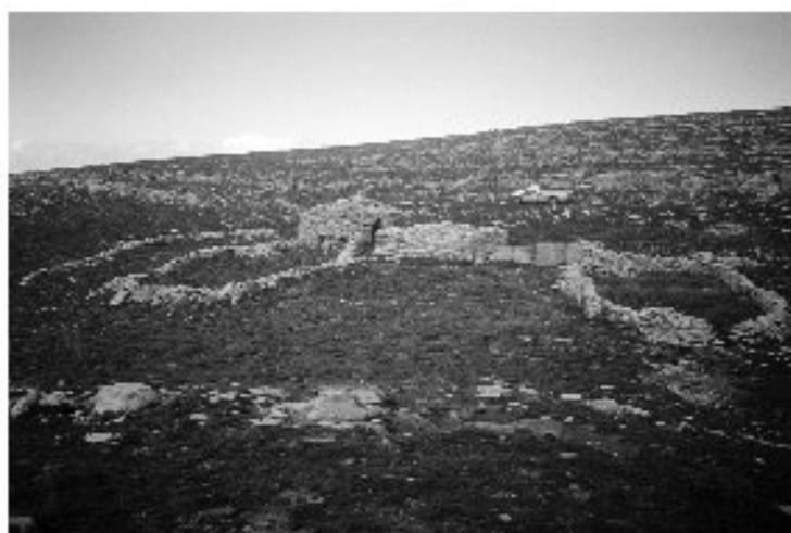
Εικ. 13. Η καλίβα στη θέση Καραμάνδρα. Θέα από τα νότια.