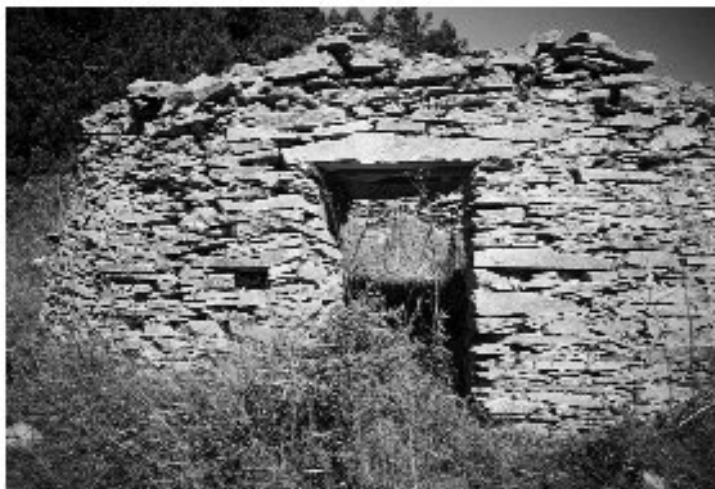
Εικ. 10. Η καλύβα στο Κούτελι. Η είσοδος.