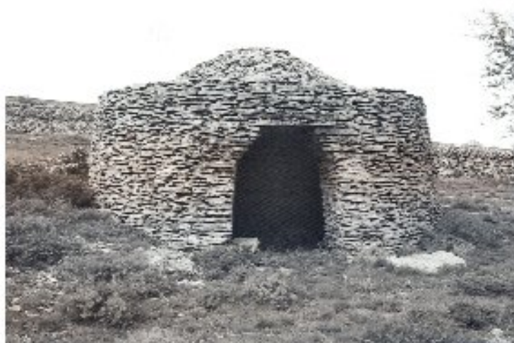
Εικ. 29. Πέτρινη στρογγυλή καλίφτα caseta στη Valencia της Ισπανίας.