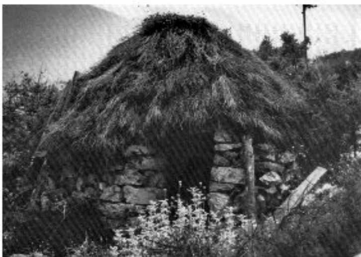
Εικ. 26. Τούφλα στον Ζάρακα Λακωνίας.