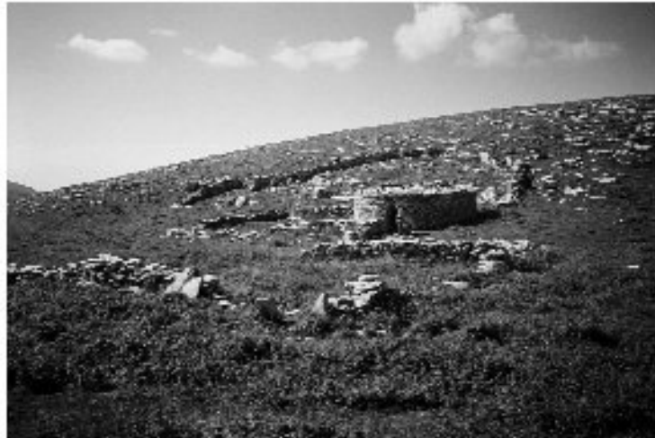
Εικ. 17. Η καλύβα στη θέση Ρουστάκα.