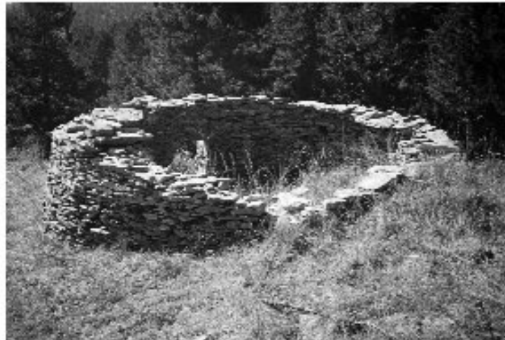
Εικ. 9. Η καλύβα στο Κούτελι από τα βόρεια.