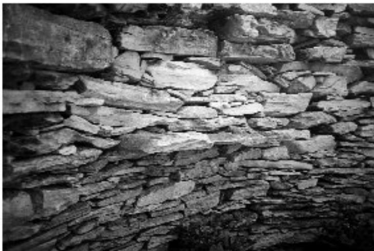
Εικ. 20. Η καλύβα στη θέση Ρουστάκα. Εσωτερική τοιχοδομία με εκφο- ρικό τρόπο.