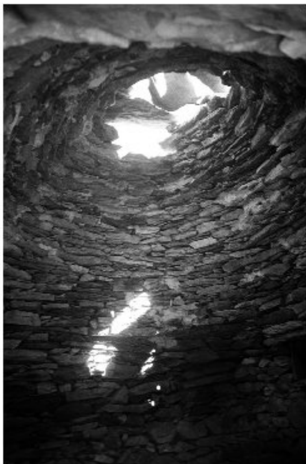
Εικ. 6. Η καλύβα στη Δέλβιστα. Λεπτομέρεια από το θόλο.