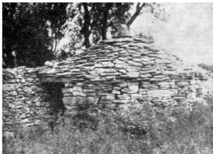
Εικ. 28. Πέτρινη στρογγυλή καλίφτα στην Ιστρία πρ. Γιουγκοσλαβίας.