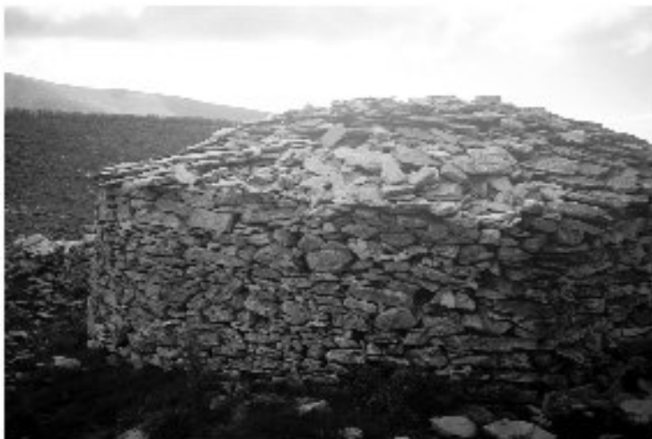
Εικ. 14. Η καλύβα στη θέση Καραμάνδρα. Θέα από τα βόρεια.