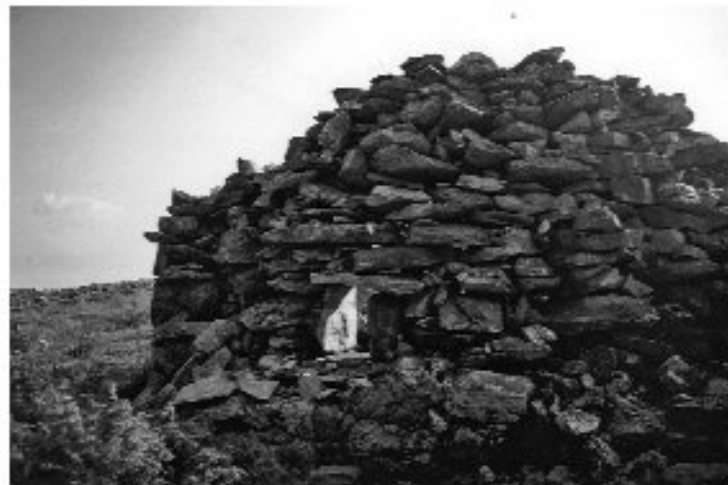
Εικ. 1. Η καλιβία στο Κουρί Ξηρότοπου από τα δυτικά.