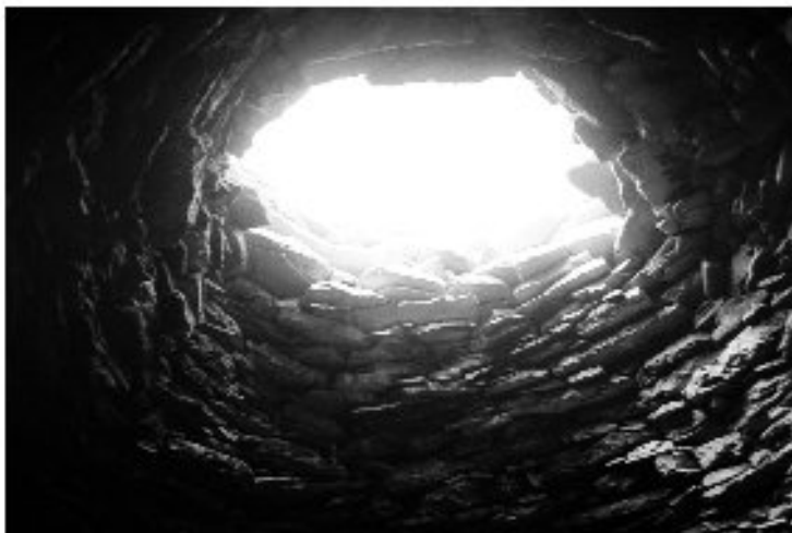
Εικ. 16. Η καλύβα στη θέση Καραμάνδρα. Το κλεί- σιμο ψηλά του θόλου.