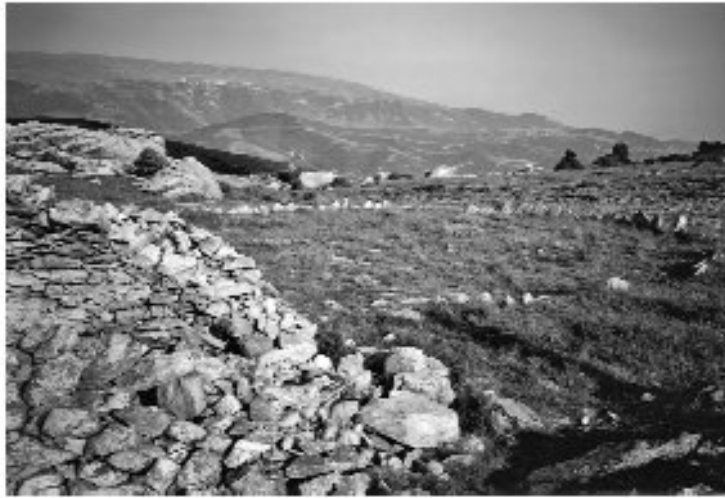
Εικ. 3. Η καλύβα στο Κουρί και το αλώϊνι.