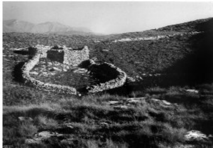
Εικ. 23. Η καλιβρα στη θέση Καρδασίμον από παλιά φωτογραφία.