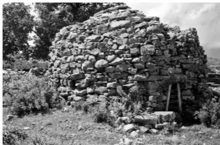
Εικ. 24. Κοίτιος στον Ψηλορείτη Κρήτης.