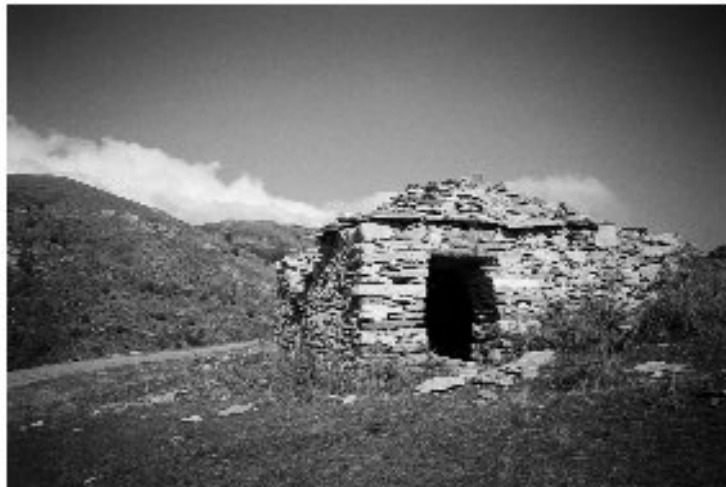
Εικ. 4. Η καλύβα στη Δέλβιστα Ορεινής.