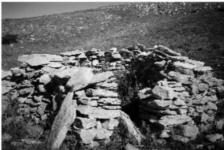
Εικ. 22. Μικρή ερειπωμένη τρογγυλή καλύβα στο Μενοίκιο.