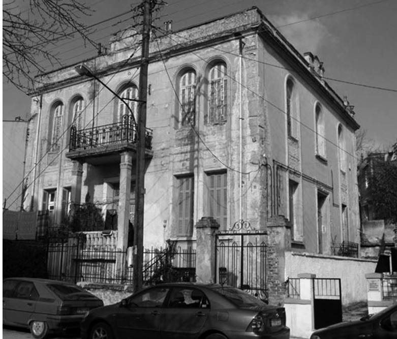
Η οικία Πατσιώκα.

Οι κατοικίες που οικοδομούνται αυτή την εποχή, συνήθως κυβόμορφες συμμετρικές κατασκευές, διώροφες ή μονώροφες με τετράρριχτη στέγη, διακρίνονται για την συντηρητικότητά τους ως προς τις μορφές και το διάκοσμο, ιδιαίτερα τα πρώτα χρόνια. Αρχετές φέρονται προσκολλημένες στο