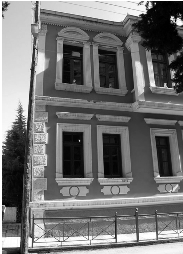
Το σπίτι του ζωγράφου Ουμβέρτου Αργυρού.

Από τα άλλα κτίσματα της ίδιας εποχής, μικρότερης όμως κλίμακας, χαρακτηριστικό είναι το σπίτι του ζωγράφου Ουμβέρτου Αργυρού. Αποτελεί γνήσιο δείγμα εκλεκτικισμού, όπου χρησιμοποιούνται