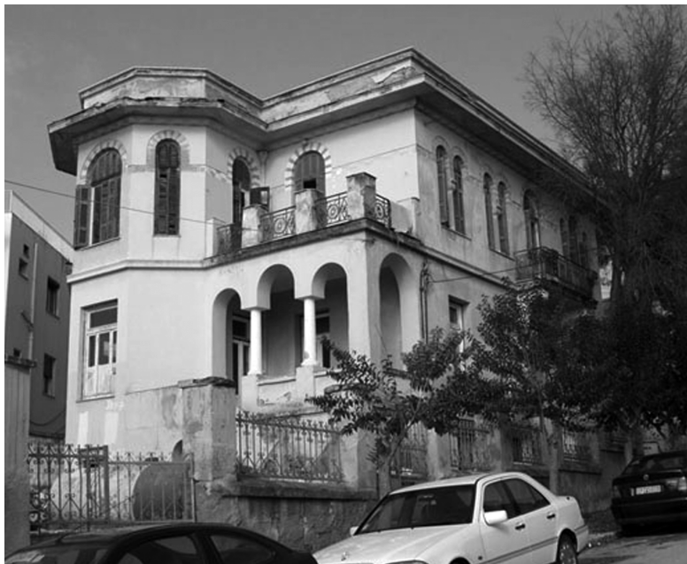
Η διώροφη οικία Σχοινά.

Φτάνοντας στο τέλος της περιπλάνησης θα λέγαμε ότι στις Σέρρες ο εκλεκτικισμός ήρθε, σχεδόν μαζί με τον υπόλοιπο ελλαδικό χώρο, δηλαδή στα τέλη του 19 ου αιώνα, αλλά τα βίαια γεγονότα που ακολούθησαν ανέκοψαν αυτή την πορεία και επανήλθε στη δεκαετία του '20, με τις αξιόλογες κατασκευές στις οποίες αναφερθήκαμε. Οι μορφές και ο διάκοσμος που εφαρμόστηκαν ήταν πιο λιτές από άλλα αστικά κέντρα. Θα μπορούσαν να γίνουν περισσότερα; Δεν το ξέρουμε και δεν έχει σημασία. Σημασία έχει να προστατεύσουμε και να διαφυλάξουμε αυτά που σώζονται ακόμη. Αυτό μπορεί να γίνει εάν υπάρχει βούληση από στους επίσημους φορείς της πόλης (Δήμο, Νομαρχία, Πολιτεία). Ο τρόπος; Έρευνα με πλήρη καταγραφή, αποτύπωση, μελέτη και ακολούθως δημοσιοποίηση και προβολή όλων των κτιρίων αυτής της περιόδου, που είναι περισσότερα από αυτά που παρουσιάστηκαν, διότι σε λίγο καιρό μόνο στις εικόνες θα τα βλέπουμε. Χρηματοδοτικά προγράμματα αν ψάξουμε θα βρεθούν. Ευχαριστούμε.