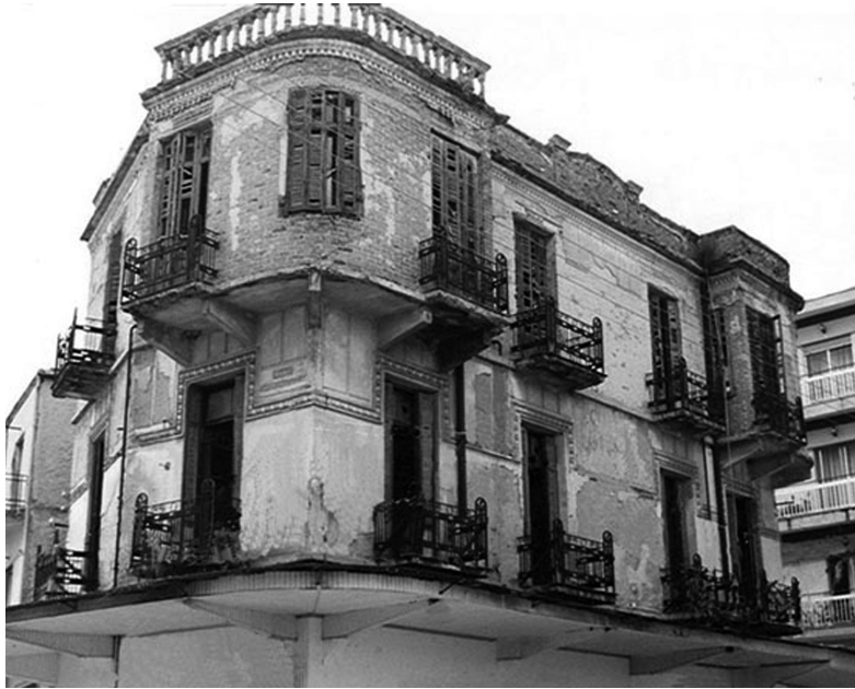
Το ξενοδοχείο “MAJESTIC”.

παίων αρχιτεκτόνων, θα εμφανιστεί ο ελβετικός τύπος ή τύπος οικίας κεντρικής Ευρώπης, με στέγες με μεγάλη κλίση. Οικία Μαρούλη, οικία Ζησίδη στο Ροδολίβος. Κλασικό δείγμα εκλεκτικισμού θεωρούμε το ξενοδοχείο “MAJESTIC”, κτισμένο σε τρεις ορόφους στα μέσα της δεκαετίας του '20. Η έντο-