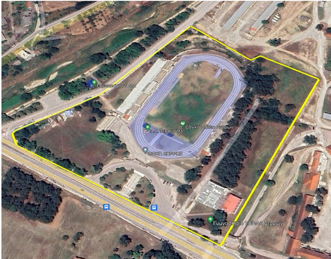
Εικόνα 1. Προτεινόμενο ακίνητο – αθλητική εγκατάσταση πρώην Εθνικού Σταδίου (αεροφωτογραφία).