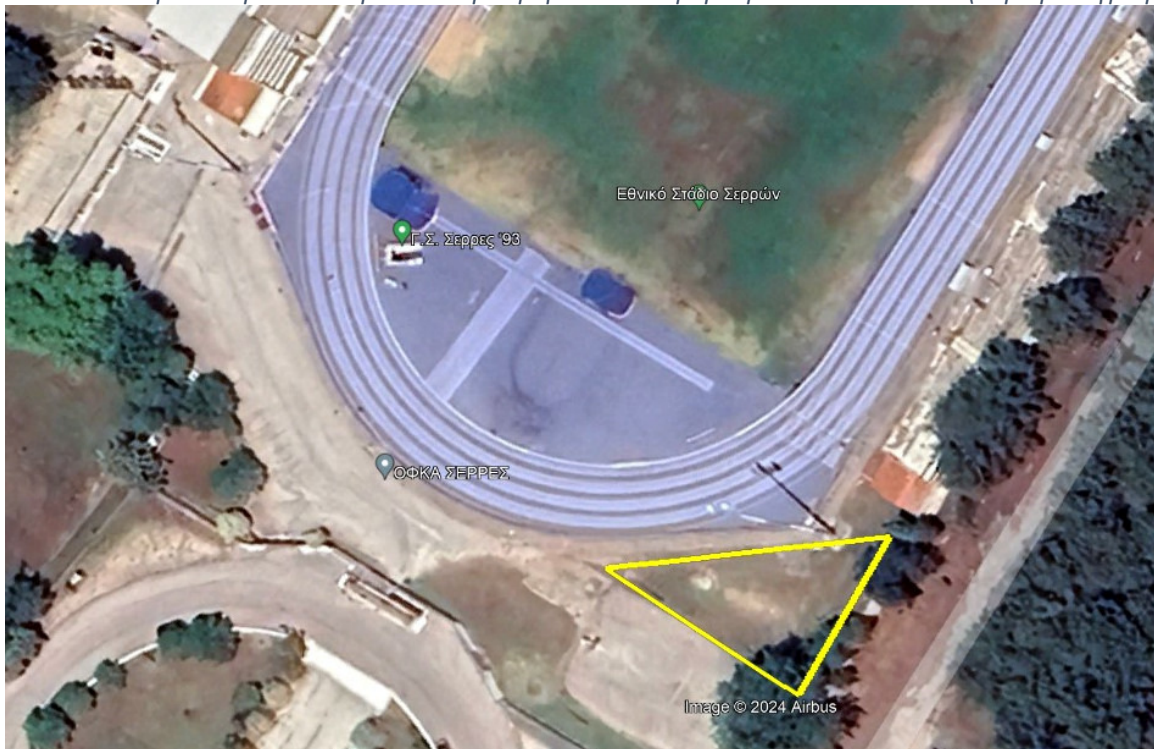
Εικόνα 2 : Προτεινόμενος χώρος εγκατάστασης οργάνων γυμναστικής εμβαδού περίπου 400τ.μ. (κίτρινη επισήμανση-αεροφωτογραφία).

Η ενδεικτική διάταξη τοποθέτησης των υπαίθριων οργάνων γυμναστικής διαστάσεων περίπου 20x10μ., παρουσιάζεται στην εικόνα που ακολουθεί :